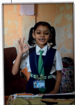
L'escola de la Mahalle Mahalle's school Akshay Ingle, Índia, 2021 10', doblat al català

Un curt molt curt sobre l'addicció a les pantalles, la tecnologia digital i la sensació d'aïllament i distracció que molts de nosaltres compartim però sovint descuidem.