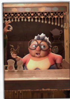
Les solistes The soloists Diversos autors, França, 2021 8', doblat al català

La Maalum, una noia negra del Brasil, rep burles per part dels seus companys de classe pel seu nom d'origen africà. Preocupada pels prejudicis que pateix, la Maalum vol canviar el seu nom, però acabarà aprenent i valorant la cultura dels seus avantpassats africans.