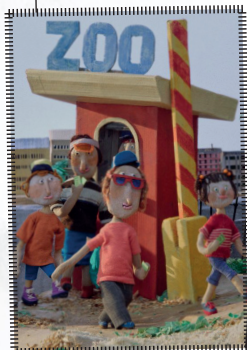
L'aterratge The landing Kaisa Penttilä Finlàndia, 2021 9'23", sense diàlegs

La Janu i el Vedu van vestits amb els seus uniformes escolars, però no van a escola. Estan a casa, mirant la pantalla d'un telèfon mòbil. A l'Índia, com a molts altres països, la pandèmia ha fet que milions de nens i nenes hagin de fer les classes online.