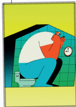
Blip Hannah Hanqing Sun Estats Units, 2021 1'12", sense diàlegs

La Zoey, una jove negra, passa pel complicat procés de rentar-se, pentinar-se i controlar els seus cabells rebels.