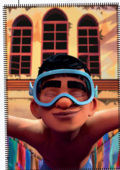
Yallah! Diversos autors França, 2021 7', sense diàlegs

En un petit poble regit per lleis ridícules, tres germanes cantants i el seu gos assagen pel Festival Anual de Tardor. Però un esdeveniment inesperat pertorbarà els seus plans.