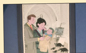
LA FOTOGRAFÍA DEL CONDE Y LA CONDESA