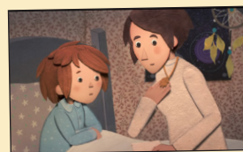
EL COLGANTE DE SU MADRE