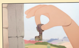
LA LLAVE DE LOS CARBONEROS