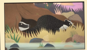
LA GUARIDA DEL TEJÓN