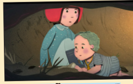
EL SUEÑO DE LUCIE