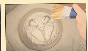
LOS CARBONEROS DEL SARCÓFAGO DE LA CRIPTA